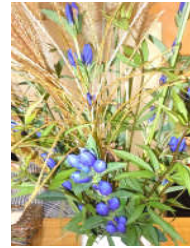
リンドウ・すすき